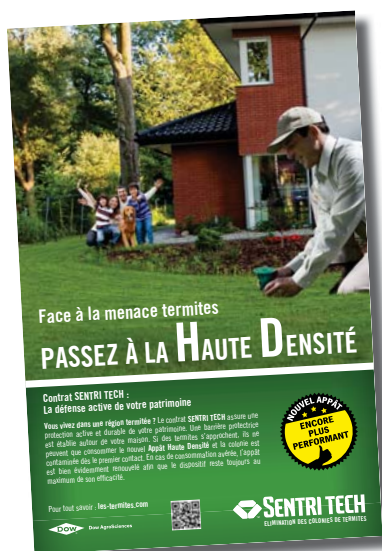
Poster SENTRI TECH

A l'occasion du lancement du contrat SENTRI TECH et de son nouvel Appât Haute Densité, la communication a fait l'objet d'une refonte globale, où l'Applicateur Autorisé SENTRI TECH , véritable homme de la situation, est clairement mis en avant.