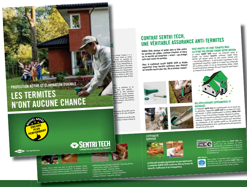
Plaquette grand public SENTRI TECH

Pour plus d'informations www.les-termites.com