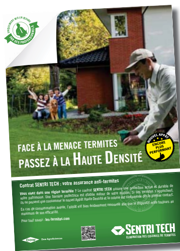
Annonce presse grand public SENTRI TECH